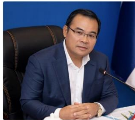
ស្ថាប័នឯកឧត្តមរដ្ឋមន្ត្រី

ឯកឧត្តម ថៅ ដេដា រដ្ឋមន្ត្រីក្រសួងធនធានទឹក និងឧតុនិយម