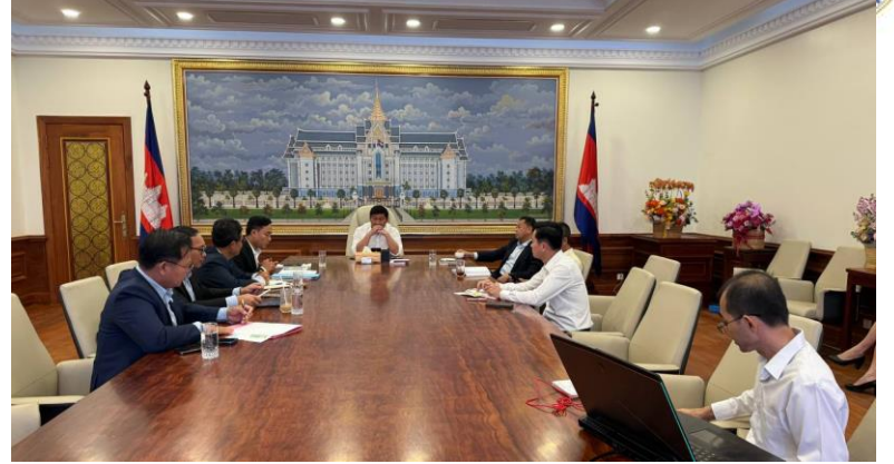
កិច្ចប្រជុំជាមួយ ឯកឧត្តម សាយ សំរោង ឧបនាយករដ្ឋមន្ត្រី រដ្ឋមន្ត្រីក្រសួងរៀបចំដែនដី នគរូបនីយកម្ម និងសំណង់ លើការងារចុះបញ្ជីអាងស្តុកទឹក ដីប្រភាពទឹក (២/៤/២០២៤)