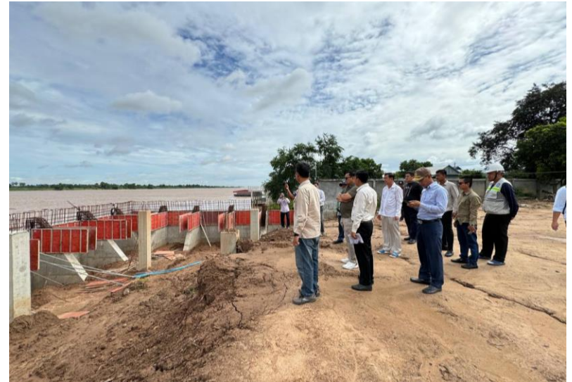
ចុះពិនិត្យទីតាំងផ្ទាល់នៅទីតាំងចាក់ដីចូលទន្លេ និងធ្វើប្រាំង នៅក្រុងអរិយរៀត (២០/៩/២០២៤)