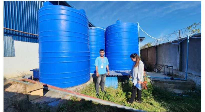
ចុះពិនិត្យទីតាំងស្នើសុំប្រើប្រាស់ទឹកក្រោមដី របស់រោងចក្រផលិតកាបូប ជារួយហ្វេង (ខេមបូឌា) លេឌឺវ ឯ.ក ស្ថិតនៅភូមិអង្គតាសិត ឃុំទួលពេជ្រ ស្រុលអង្គស្នួល ខេត្តកណ្តាល (២៨ វិច្ឆិកា ២០២៤)