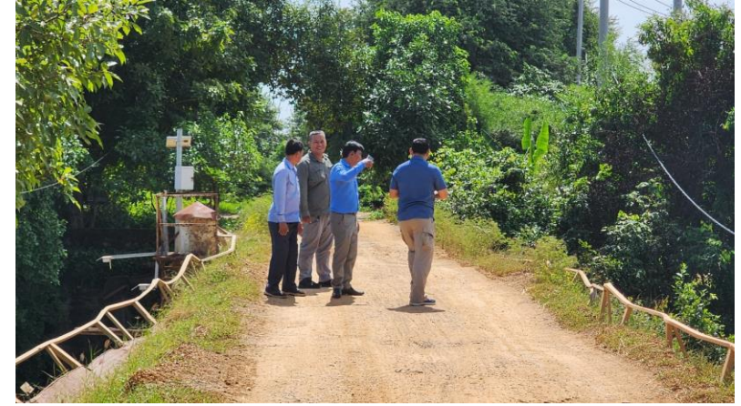
ចុះពិនិត្យទីតាំងស្នើសុំវិនិយោគបង្កើតស្ថានីយវារីអគ្គិសនីខ្នាតតូច នៅស្ថានីយពាមឃ្លៃ ក្នុងភូមិ ពាមឃ្លៃ ឃុំទំព័រមាស ស្រុកសំរោងទង ខេត្តកំពង់ស្ពឺ (៧/១១/២០២៤)