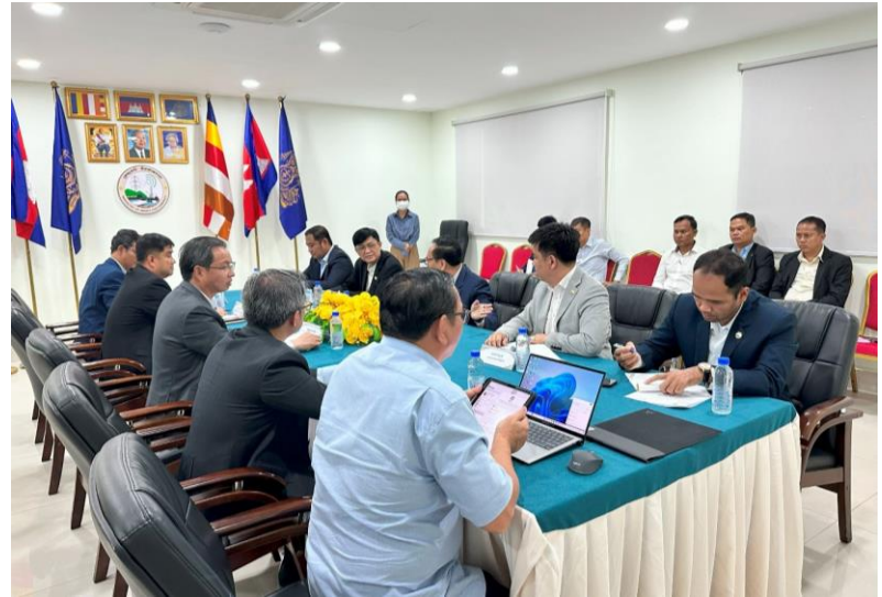
កិច្ចប្រជុំជាមួយក្រសួងរ៉ែ និងថាមពលលើការចែករំលែកព័ត៌មានការប្រើប្រាស់ទឹកដើម្បីផលិតអគ្គិសនី (១៤/៨/២០២៤)