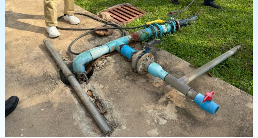
ចុះពិនិត្យទីតាំងប្រើប្រាស់ទឹកក្រោមដីរបស់ក្រុមហ៊ុន TOP SPORTS TEXTILE LTD ក្រុងបារិត ខេត្តស្វាយរៀង (១៩ មករា ២០២៤)