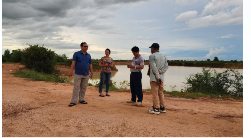
ចុះពិនិត្យទីតាំងស្នើសុំការអនុញ្ញាតប្រើប្រាស់ទឹកទំនប់ ៧៨ សម្រាប់ផលិតផ្គត់ផ្គង់ទឹកស្អាត ដែលមានទីតាំងស្ថានីយនៅភូមិស្រម៉ែធំ ឃុំជានរុន ស្រុកសូនិតម ខេត្តសៀមរាប (១២/៧/២០២៤)