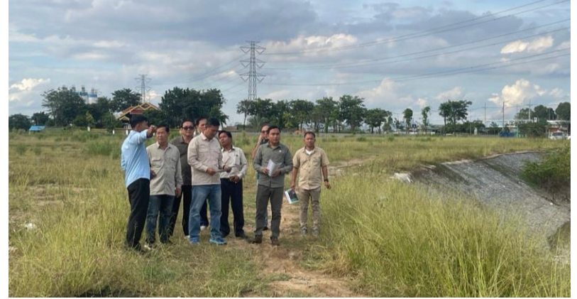
ចុះពិនិត្យទីតាំងផ្ទាល់ចំណីស្ទឹងព្រែកត្នោត នៅរាជធានីភ្នំពេញ (២៩/១០/២០២៤)