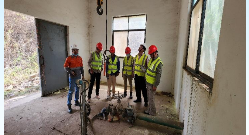
ចុះពិនិត្យទីតាំងស្នើសុំការអនុញ្ញាតប្រើប្រាស់ទឹកក្រោមដីនៅរោងចក្រផលិតស៊ីម៉ង់ត៍ របស់ក្រុមហ៊ុន ជីបម៉ុង អ៊ិនស៊ី ស៊ីមេនខបកើអេសិន (CMIC) ក្នុងខេត្តកំពត (១៧/៥/២០២៤)