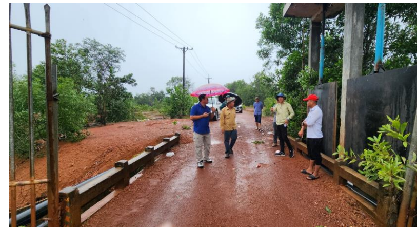
ចុះពិនិត្យការសាងសង់សំណង់ទប់ទឹក ស្ថានីយ៍ផលិតទឹកស្អាត ខេត្តព្រះសីហនុ (ក្រុមហ៊ុន អានកូរ៉េដើរ សីបង្ហាយ) នៅ ខេត្តព្រះសីហនុ (១៦/៧/២០២៤)