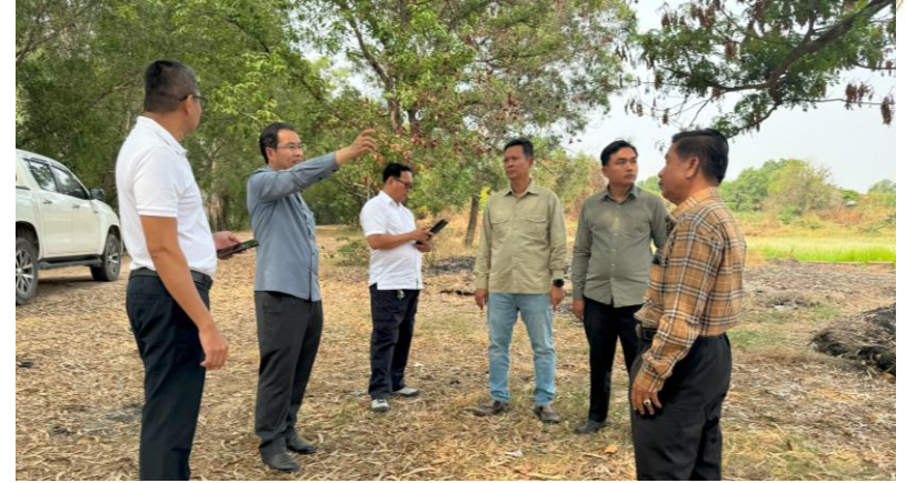
ចុះពិនិត្យទីតាំងផ្ទាល់ ដែលស្នើសុំបញ្ជាក់ពីផលប៉ះពាល់ដល់ចំណីស្ទឹង របស់ទីតាំងក្បាលដីចំនួន២ នៅអាងតម្កល់ទឹកទំនប់ ៧ មករា (២៣/៤/២០២៤)