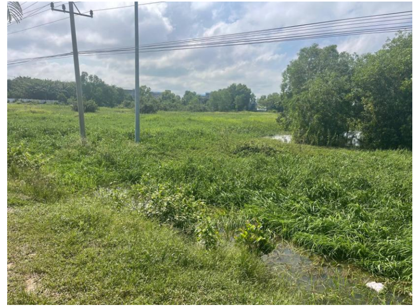
ចុះពិនិត្យទីតាំងដីអាងទឹកតាកែវ ដែលសាខាគយនិងរដ្ឋាករខេត្តតាកែវស្នើសុំ សម្រាប់សាងសង់អាគាររដ្ឋបាល អាគារស្នាក់នៅ និងហេដ្ឋារចនាសម្ព័ន្ធសាខាគយនិងរដ្ឋាករខេត្តតាកែវ (៥/១១/២០២៤)