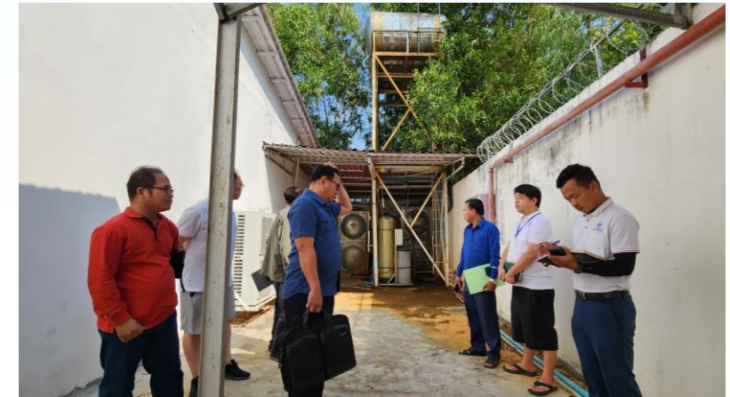
ចុះពិនិត្យទីតាំងស្នើសុំការអនុញ្ញាតប្រើប្រាស់ទឹកក្រោមដីសម្រាប់ដំណើរការរោងចក្រផលិតសំភារៈកីឡា ជាប់បែលយូកី ស្តីត (ខេមបូឌា) ឯ.ក ក្នុងខេត្តស្វាយរៀង (២ កុម្ភៈ ២០២៤)